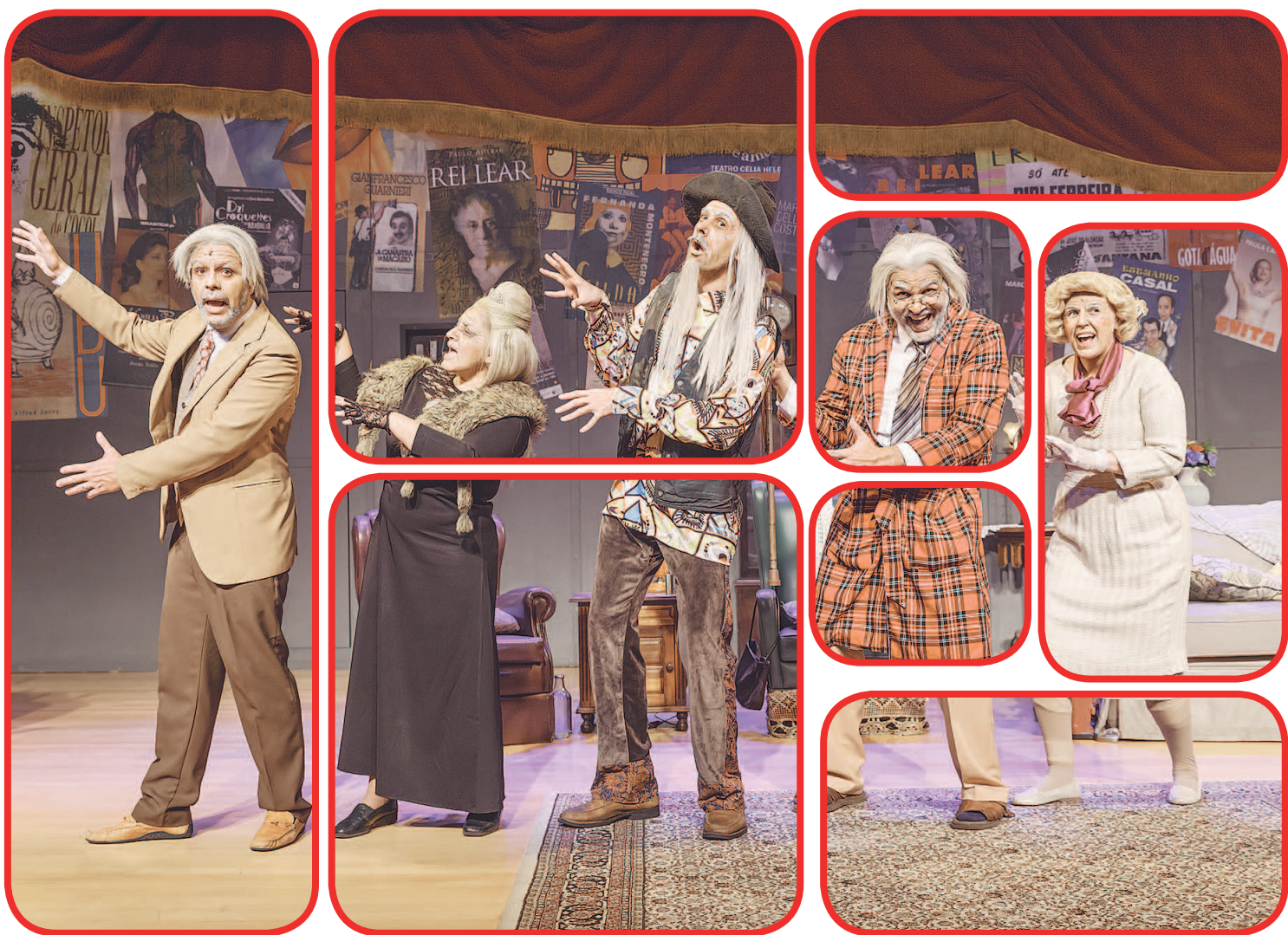
Os atores de 'Forever Young' representam a si mesmos já no futuro, quando todos já estão perto dos cem anos

As dificuldades que estes simpáticos senhores enfrentam nesta fase da vida, entretanto, não os impedem de continuar cantando, divertindo-se e se amando, sempre sob a supervi-