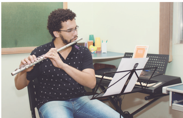
O espaço oferece aulas de vários instrumentos, dentre eles flauta